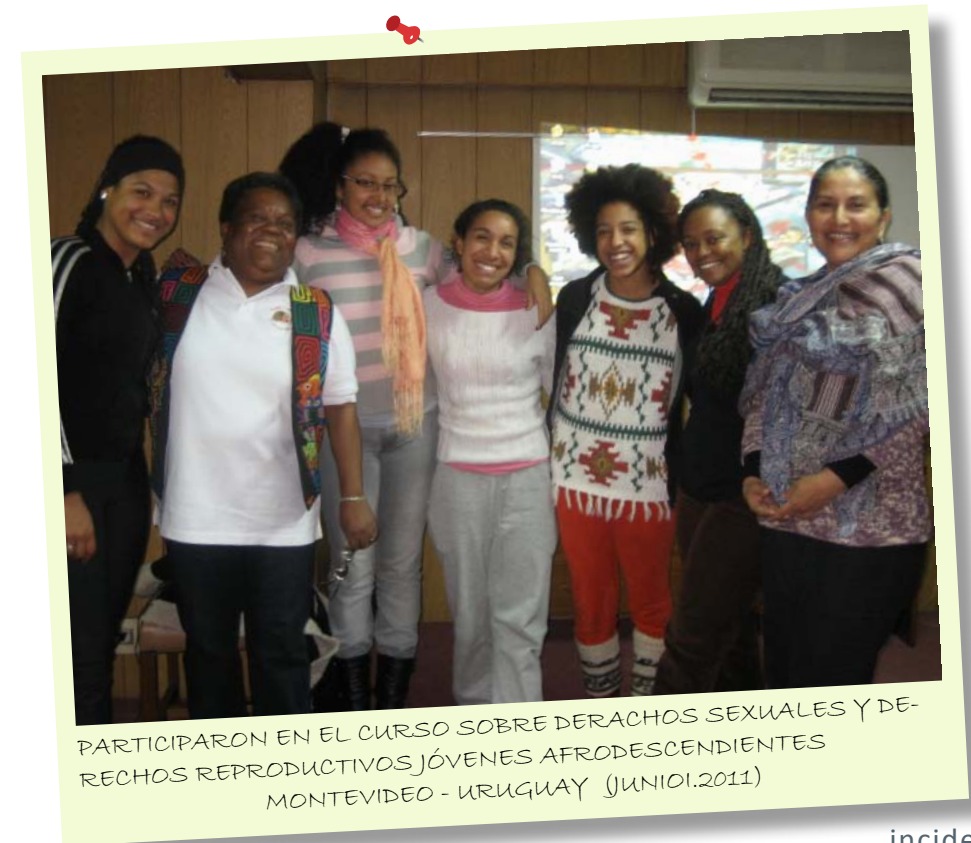
PARTICIPARON EN EL CURSO SOBRE DERECHOS SEXUALES Y DERECHOS REPRODUCTIVOS JÓVENES AFRODESCENDIENTES MONTEVIDEO - URUGUAY (JUNIO 2011)

Durante cuatro días se analizó el estado de los Derechos Sexuales y Reproductivos de mujeres jóvenes afrodescendientes en el Cono Sur y la Región Andina, desde un enfoque de derechos humanos, se identificaron líneas comunes que faciliten estrategias de