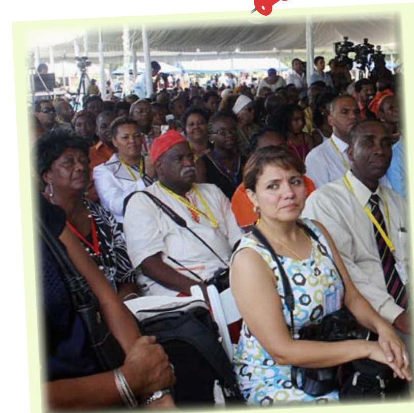
PRIMERA CUMBRE MUNDIAL DE AFRODESCENDIENTES

El Informe Regional sobre Desarrollo Humano para América Latina y El Caribe 2010, presentado por el PNUD señala: "En América Latina y El Caribe hay poco más de 50 millones de indígenas y 120 millones de afrodescendientes, que representan alrededor de 33% de la población de la región. Al analizar los avances de la Población Eurodescendiente (PED), por un lado, y de la Población Indígena y Afrodescendiente (PIAD), por el otro, aún se observan brechas en términos de avance hacia los objetivos de desarrollo del milenio (ODM) (Busso, Cicowiez y Gasparini, 2005). 7 Por ejemplo, los niveles de pobreza son notoriamente mayores en la Población Indígena y Afrodescendiente que en la Población Eurodescendiente..."