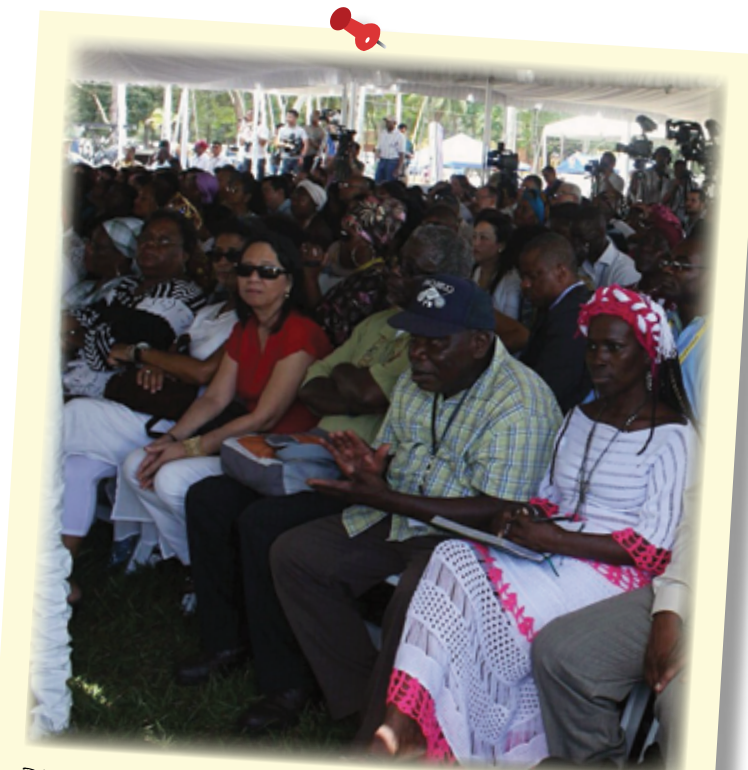
PRIMERA CUMBRE MUNDIAL DE AFRODESCENDIENTES. HONDURAS 2011

En sus párrafos 15 y 16 reconoce que la xenofobia contra personas extranjeras, particularmente contra migrantes, refugiados/as y quienes solicitan