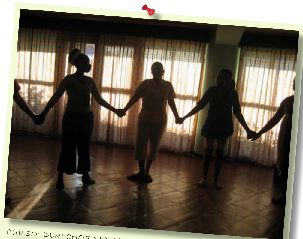
CURSO: DERECHOS SEXUALES Y DERECHOS RESPRODUCTIVOS MANAGUA - NICARAGUA (OCTUBRE 2011)

de sus aportes a la labor de incidencia de la RMAAD en los gobiernos locales, nacionales e instituciones intergubernamentales de América Latina, el Caribe y la Diáspora para fortalecer el reconocimiento de los mismos en el conjunto de leyes, políticas y planes.