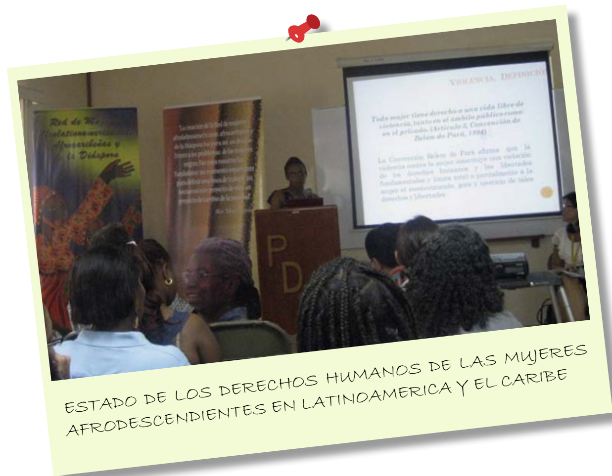
ESTADO DE LOS DERECHOS HUMANOS DE LAS MUJERES AFRODESCENDIENTES EN LATINOAMERICA Y EL CARIBE

En términos promedios en la región latinoamericana y caribeña, las mujeres afrodescendientes se ubican en los estratos más bajos de la sociedad y por tanto más pobres, realizan trabajos de menor remuneración, principalmente, en las empresas de zonas francas (maquila), en el trabajo doméstico remunerado y en la economía informal, como resultado de la marginación en su condición de mujer y del racismo que prevalece en nuestra sociedad.