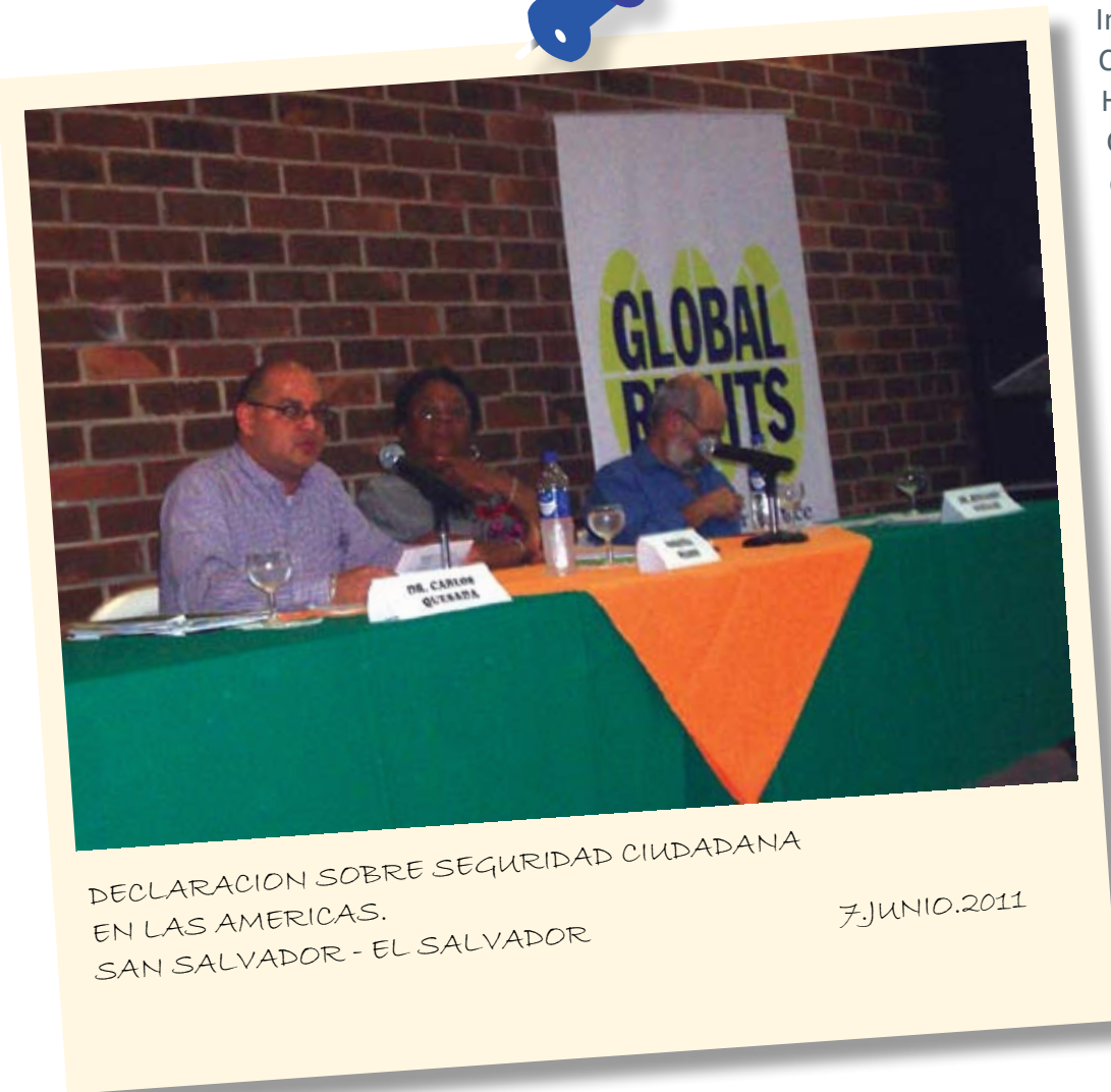
DECLARACION SOBRE SEGURIDAD CIUDADANA EN LAS AMERICAS. SAN SALVADOR - EL SALVADOR

Reafirmando que las Reuniones de Ministros de Justicia u otros Ministros, Procuradores o Fiscales Generales de las Américas (REMJA) y otras reuniones de autoridades en materia de justicia penal son foros importantes y eficaces para la promoción y el fortalecimiento del entendimiento mutuo, la confianza, el diálogo y la cooperación en la formulación de políticas en materia de justicia penal y de respuestas para hacer frente a las amenazas a la seguridad; Recordando los derechos consagrados en la