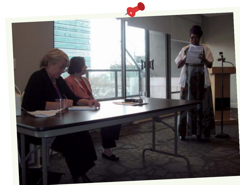
LECTURA DE CARTA A MICHELLE BACHELET.